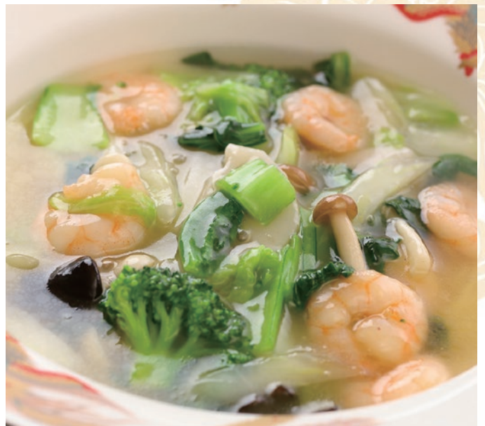
⑤海老あんかけそば