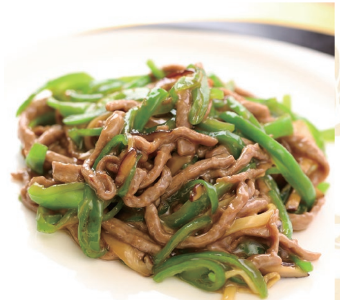
③牛肉とピーマンの細切り炒め