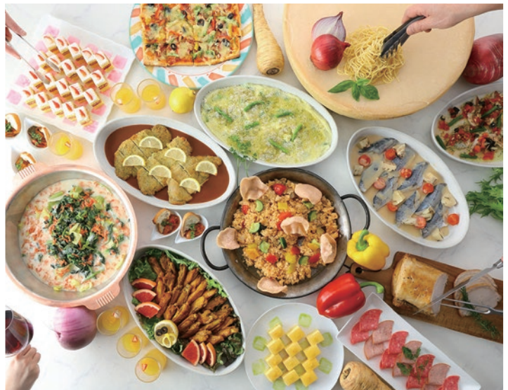
▲カーメルは、ホームメイドのこだわりビュッフェ