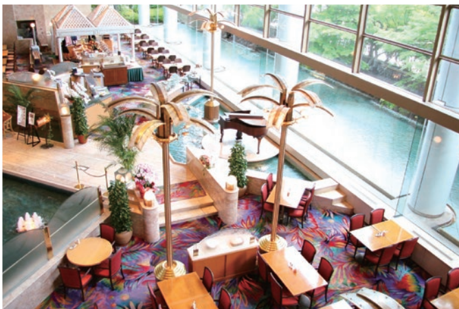
▲平日ディナータイム時のご宴会や店内貸切などをご相談ください