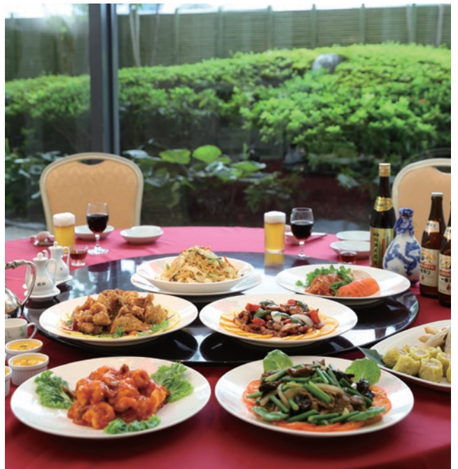
個室確約! 室料無料で飲み放題付きのお得プラン! 落ち着いた個室でお食事をお楽しみ頂けます。本プランは3日前までの予約制。6名様より承ります。