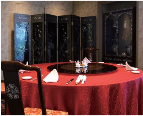
▲大小合わせて5つの個室をご用意。最大40名まで承ります 上記写真は個室「牡丹」